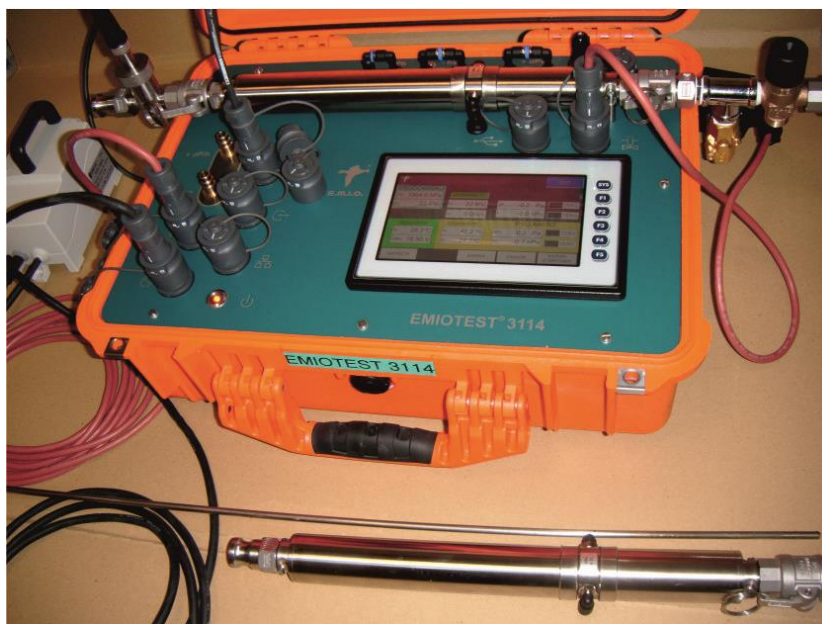
Jednostka sterująca pyłomierza typu EMIOTEST 3114