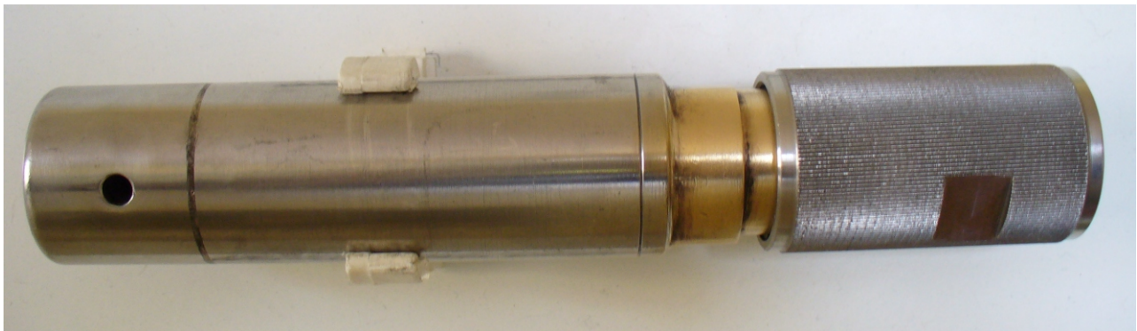
Głowica rurki spiętrzającej typu walcowego