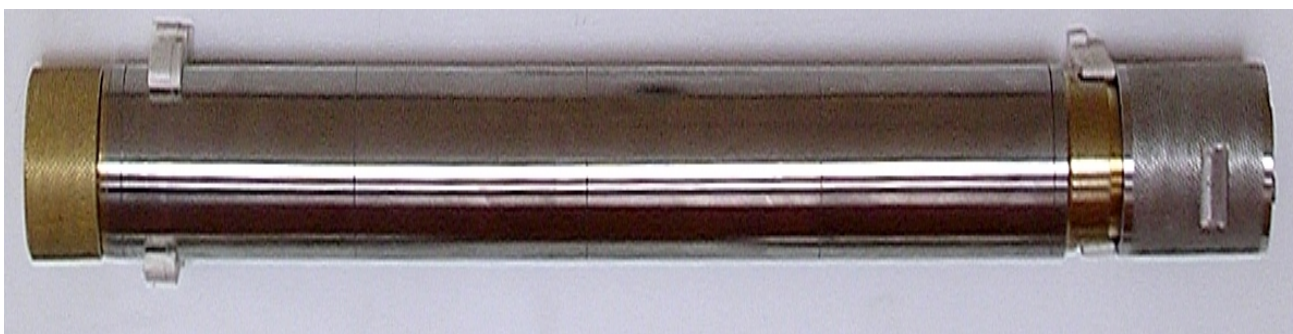
Segment rurki spiętrzającej